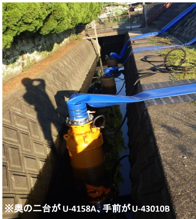
※奥の二台がU-4158A、手前がU-43010B

排水路の幅が狭いうえに、住宅街からも雨水が流入するため放流ゲート閉鎖時に排水路が満水になってしまう。 排水路の水が溢れ、住宅街に浸水する前に直接河川に放流するため大水量ポンプを導入した。