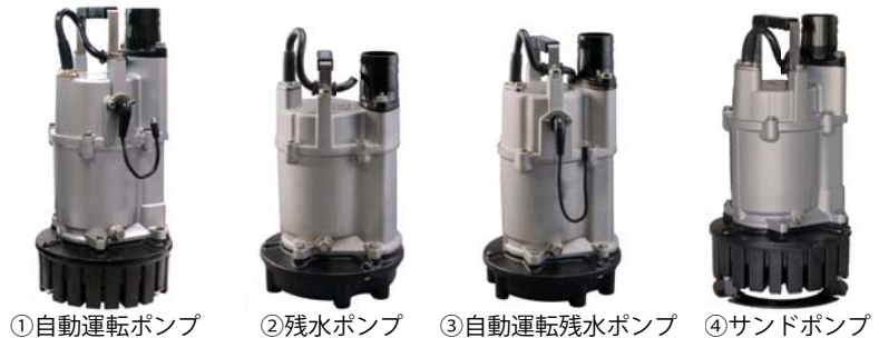
①自動運転ポンプ ②残水ポンプ ③自動運転残水ポンプ ④サンドポンプ